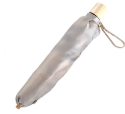
こもれび ブナ 折りたたみ傘 グレー