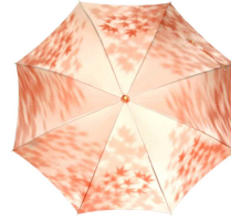
こもれび カエデ スライドショート傘 オレンジ