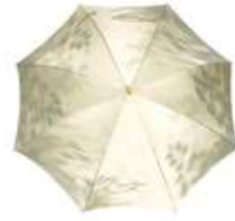
こもれび ブナ スライドショート傘 グリーン