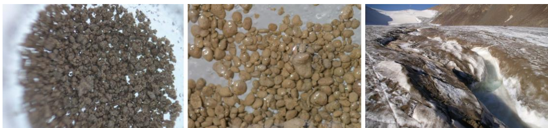
図 2:(左)グリーンランドのクリオコナイト

このように物質循環や氷河融解の観点から注目されてきたクリオコナイトですが、これまでの研究では一部の微生物やその微生物の生理機能しか調査されておらず、特に微生物群集のゲノムに関する情報はほとんどありませんでした。したがって、クリオコナイト内でどのような微生物種がどのような活動をしているのか、その実態はあまりわかっていませんでした。