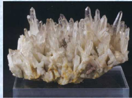
水晶峠産水晶晶族 長柱状結晶の群晶からなり、一部草入り、昭和9年産出。

六面体の結晶面を完全な形で備えた、世界的に数少ない大型水晶です。脇水鉄五郎博士によって地質学雑誌（1918年）によって発表されました。これによると、水晶の長さ97cm、最大幅径30cm、周囲80cm、柱面の最大幅18cm、重量77.5kg、結晶半透明、柱面は磨かれています。